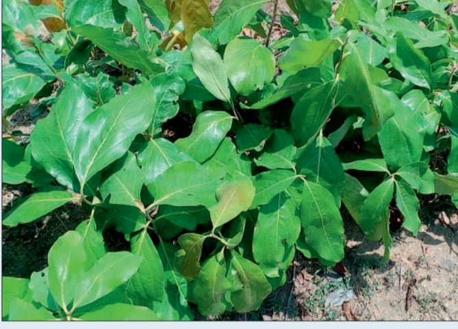
उत्पादन में उल्लेखनीय वृद्धि होती है। इसका सीधा लाभ संग्राहकों को अधिक आय के रूप में मिलता है, वहीं शासन को भी राजस्व में बढ़ोतरी होती है। आगामी सीजन में बेहतर उत्पादन की उम्मीद जताई जा रही है।

कबीरधाम जिले में ग्रीन गोल्ड कहे जाने वाले तैदुपता के बेहतर उत्पादन के लिए साख कतरन का कार्य सफलतापूर्वक पूर्ण कर लिया गया है। वन विभाग के मार्गदर्शन में यह कार्य निष्पत्ति समय सीमा में संपन्न हुआ। विशेषज्ञों के अनुसार साख कतरन से तैदुपता की नई कोपले अधिक संख्या में निकलती हैं, जिससे