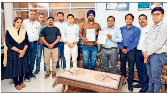
हरिभूमि न्यूज ►► बोड़ला

विद्यार्थियों के सर्वांगीण विकास, गुणवत्तापूर्ण शिक्षा, कौशल विकास तथा शिक्षा को रोजगारोन्मुखी बनाने के लिए शासकीय स्वामी विवेकानंद महाविद्यालय एवं समर्थ चैरिटेबल ट्रस्ट के बीच एमओयू पर हस्ताक्षर किए गए। इस समझौता के तहत महाविद्यालय में एक तरह का नवाचार किया जा सकेगा, जिससे विद्यार्थियों को व्यावहारिक प्रशिक्षण देकर आवश्यकतानुसार रोजगार के अवसर भी उपलब्ध कराया जायेगा। इस एमओयू के दौरान महाविद्यालय