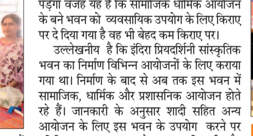
दिल्ली के व्यापारी पर मेहरबानी

उल्लेखनीय है कि इंदिरा प्रियदर्शिनी सांस्कृतिक भवन का निर्माण विभिन्न आयोजनों के लिए कराया गया था। निर्माण के बाद से अब तक इस भवन में सामाजिक, धार्मिक और प्रशासनिक आयोजन होते रहे हैं। जानकारी के अनुसार शारीक सहित अन्य आयोजन के लिए इस भवन के उपयोग करने पर प्रतिदिन मात्र चार हजार के अलावा बिजली और सफाई का शुल्क देना होता है। कम शुल्क होने के कारण गरीब तबके के लोग इस भवन का उपयोग करते रहे हैं, किंतु आने वाले दिनों में यह भवन आम लोगों को नहीं मिल पाएगा वजह यह है कि नगर प्रशासन ने इसे मासिक किराए पर दे दिया है।