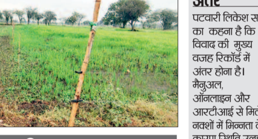
तहसील ने बदल दिया नक्शा